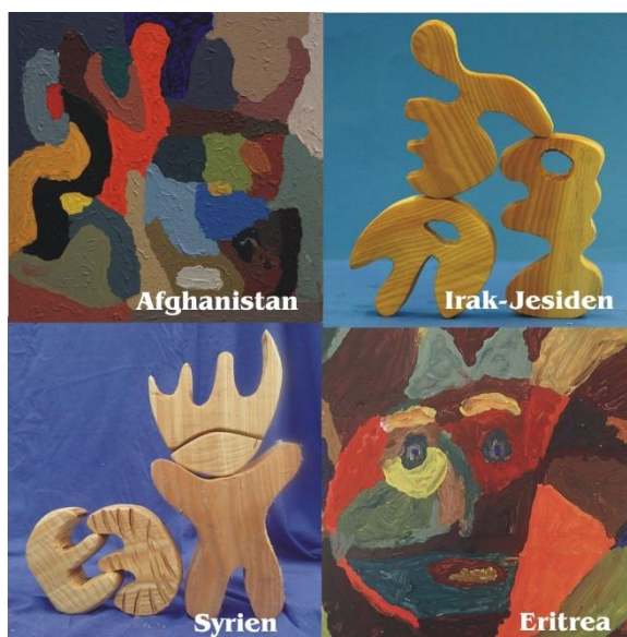
На рис. 8 и 9 семинары с беженцами и примеры их работ