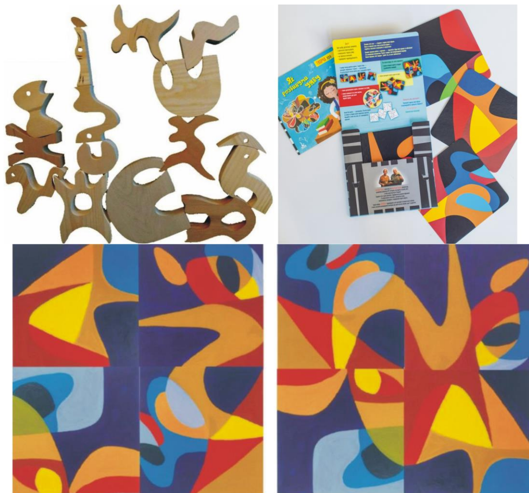
Рис. 6 Внизу - два примера из возможных 6144-х при составлении квадратной картины из четырех частей. Наверху - балансирование на грани возможного и один из трех - живописных, графических и фантазийных наборов «Вариабилы» на бумаге (Украина, издательство Ранок)

машинной обработке, обеспечивают создание балансирующих комбинаций на грани возможного (рис. 6)