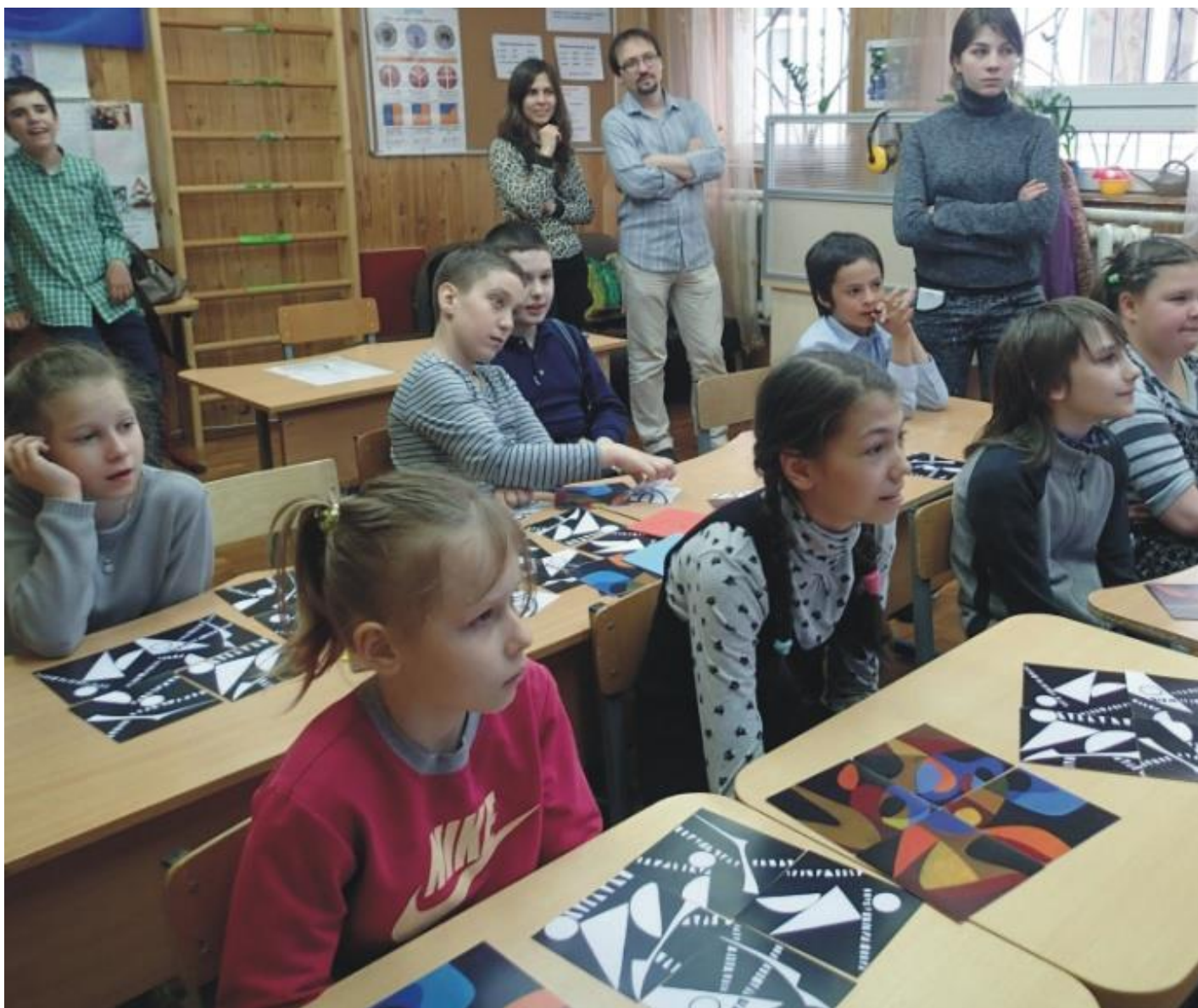
Рис. 10. Занятия в специализированной школе, Москва. Дети с расстройствами аутистического спектра.

Долгосрочный проект для России и Германии запланирован на территории Урала с нашими партнерами (благотворительный фонд Чайковского) в рамках Дней культуры Германии в России 2021, где произойдет встреча-объединение российских «Вариабилы» из дерева («Монтессори-Питер»), украинских на бумаге (издательство «Ранок») и наших, с новыми идеями, создаваемых вручную в Германии (галерея Dreiklang или Трехзвучие).