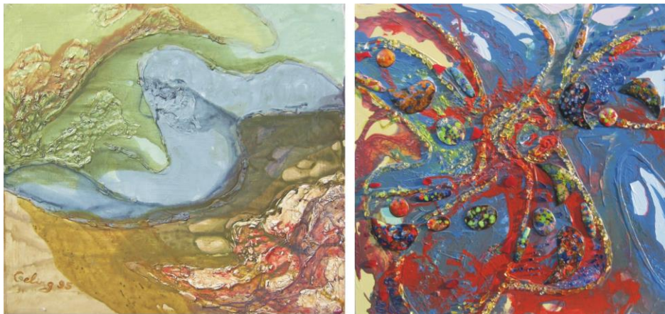
Рис. 4 Картины: «Страна фантазия» и «Жар-птица»

Неопределенность интерпретации предоставляет зрителю возможность включения в творческий процесс через собственные ассоциативные образы. Возникает эмоциональный контакт, некий резонанс между произведением и зрителем, когда, глядя на картину «Страна Фантазия» (рис. 4), восьмилетняя Наташа С. из Нижнего Новгорода пишет: «Камни бури были странно фантазные, и буря пинала их волнами и они жаловались небу...», а ее одноклассник Митя С. видит в скульптуре «круглый каменный шар, который заворачивается в туман».