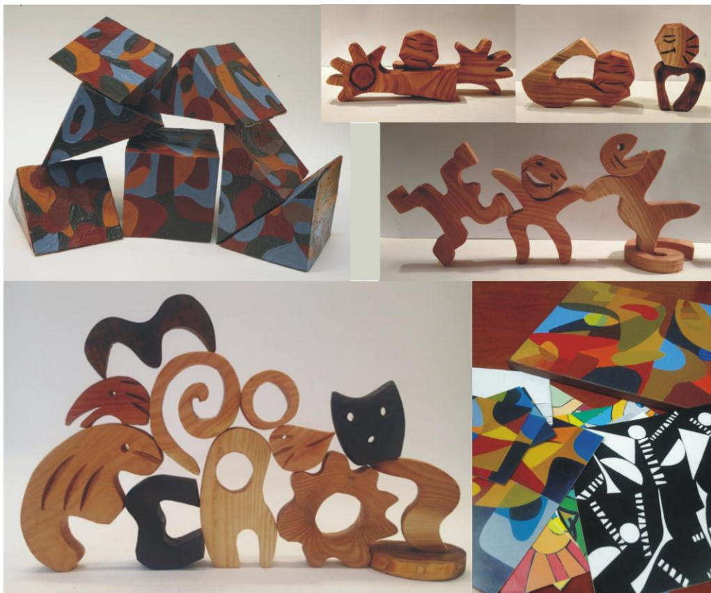
Рис. 5 Вариабельные игровые наборы: деревянные, живописные, графические, объемно красочные со звучанием пересыпающегося внутри материала и эмоциональные.

При разработке игровых наборов для методологии «Вариабилы» нами использован аналогичный принцип. Создавались необычные по форме абстрактные скульптурные, живописные и графические элементы, обладающие комплементарностью (рис. 5)