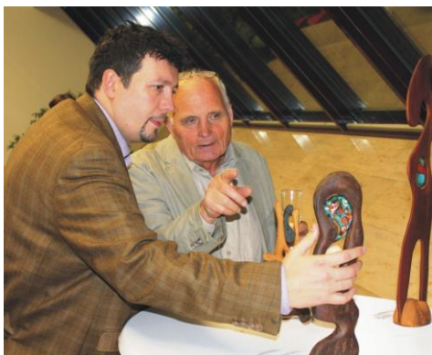
Рис. 1-2 Выставки: Чебоксары, Центр современного искусства Чувашского государственного художественного музея и Москва, Посольство ФРГ