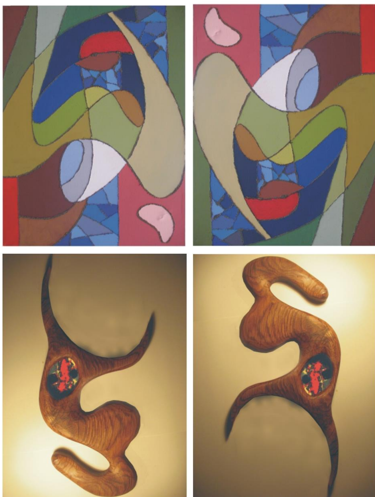
Рис. 3 Картину, скульптуру или рельеф можно поставить вверх ногами.